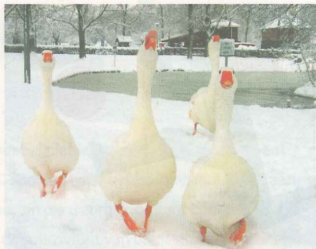
Ganzen in het park

Van 1 maart tot 1 november mag in Noord-Holland weer op ganzen gejaagd worden. Hans Simons denkt dat jagen onmisbaar is voor het terugdringen van de ganzenoverlast, Ton Pieters vindt dat andere methoden effectiever zijn.