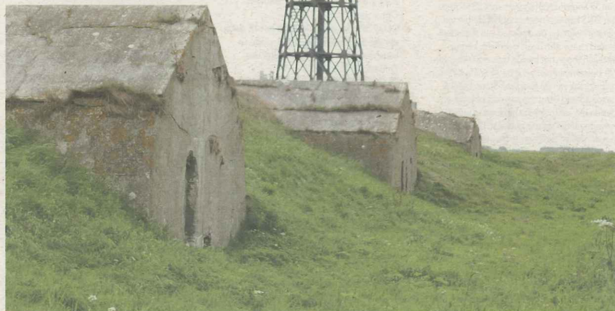
Het Vuurtoreneiland bij Durgerdam krijgt een tijdelijk restaurant.

Op dit moment is het eiland vlak boven Amsterdam niet toegankelijk voor publiek en Staatsbosbeheer wil dat veranderen. Staatsbosbeheer is daarom in 2012 een openbare aanbestedingprocedure gestart waarbij wordt gezocht naar een exploitant die het eiland langjarig gaat exploiteren, restaureren en openstellen voor publiek. In september wordt bekend wie deze exploitant wordt. Vuurtoreneiland in het IJmeer bij Durgerdam is nog geen twee voetbalvelden groot. Staatsbosbeheer is eigenaar van het eiland waar naast een fort ook een kleine vuurtoren op staat. Samen met Pampus en Fort Diemerdam verdedigde dit stipje in het IJmeer ooit de toegang tot het IJ en de hoofdstad tegen aanvallen over de Zuiderzee.