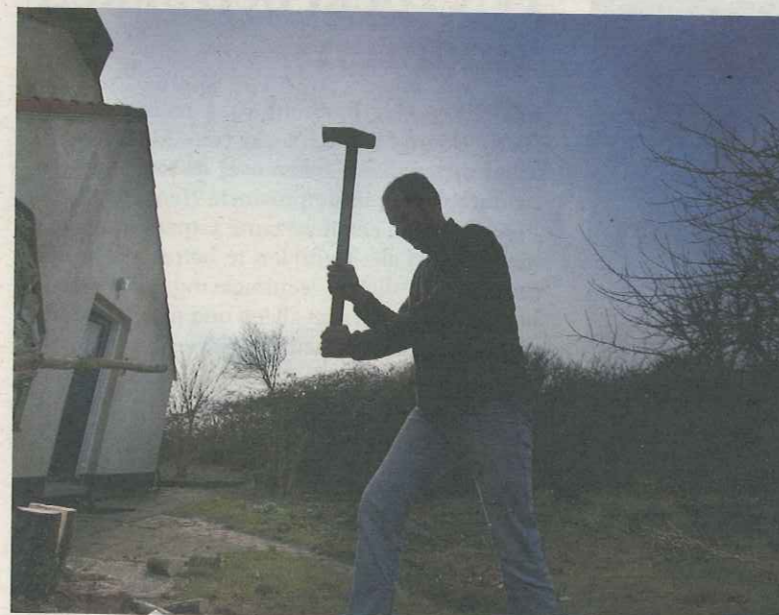
Hoe is het om te wonen op een verder onbewoond eiland?

DURGERDAM - Oog in oog staan met een edelhart, een ontmoeting