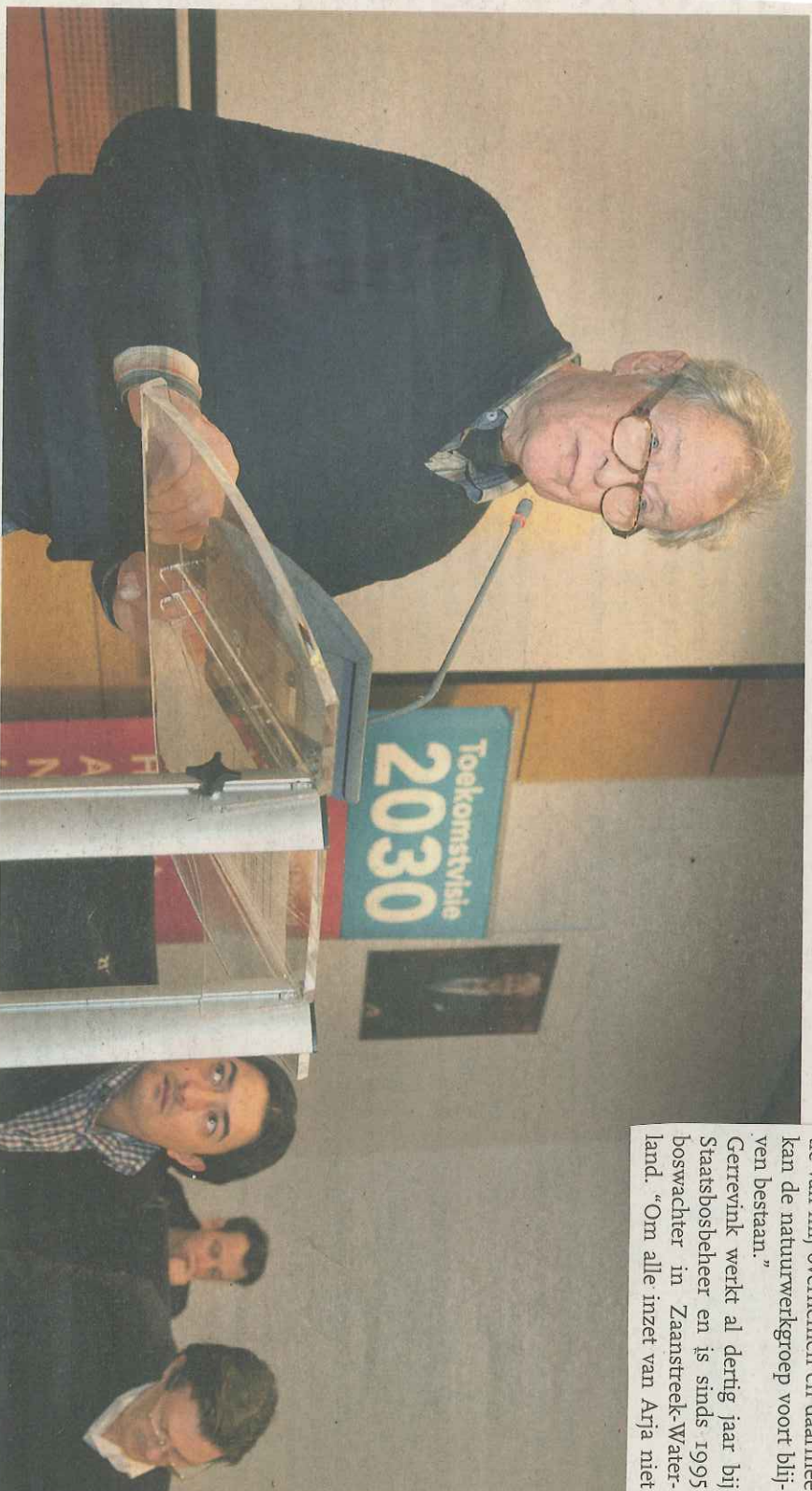
Insprekter tijdens de hoorzitting Toekomstvisie 2030

"Geef u massaal op en graag ontmoet ik u op de eerste volgende werkdag op zondag 8 december, dan gaan we gezamenlijk werken aan een mooi Waterland", besluit de boswachter.